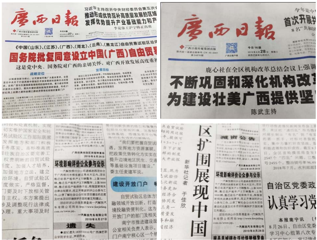
图 3-2 报纸公示