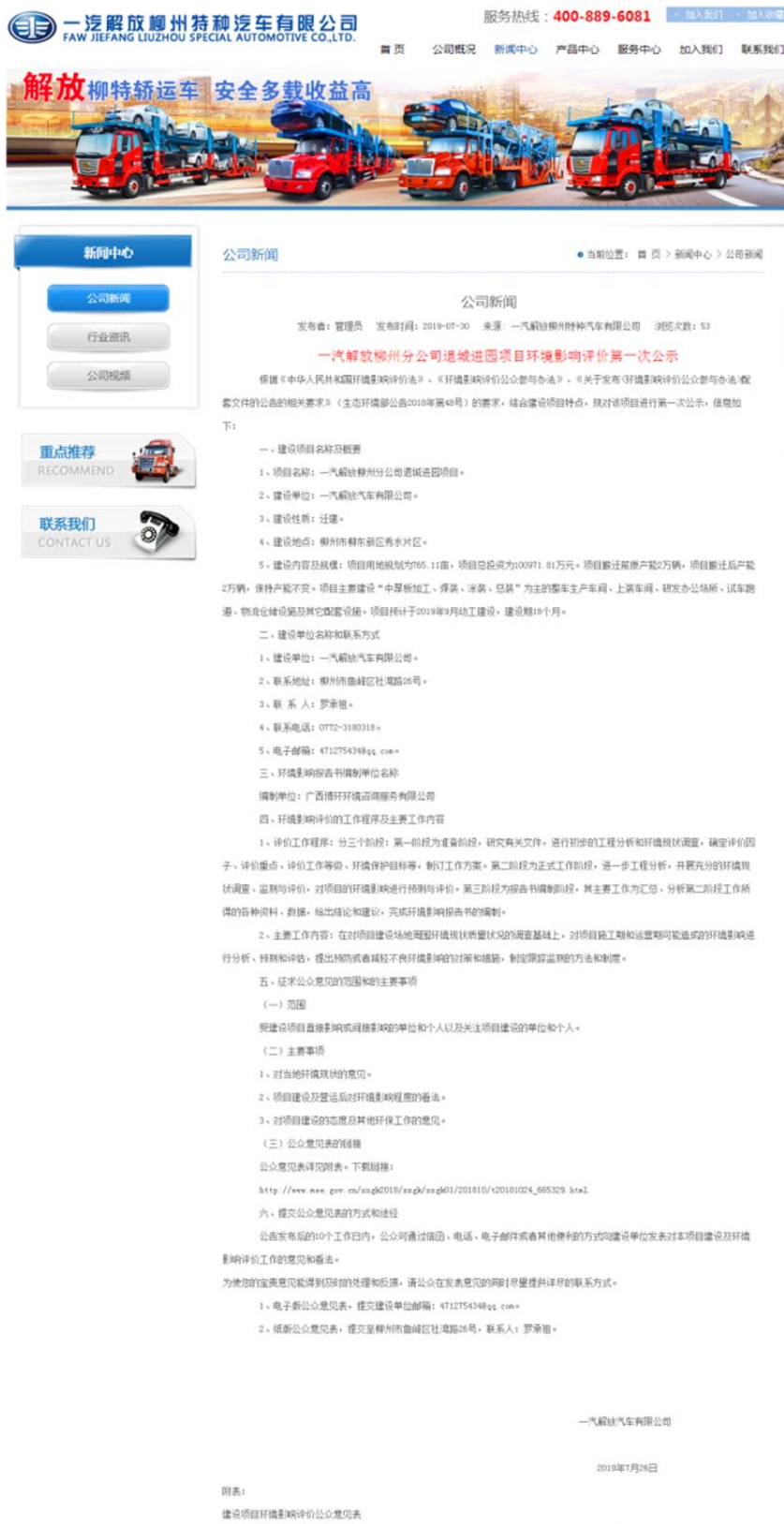
图 2-1 第一次网上公示截图